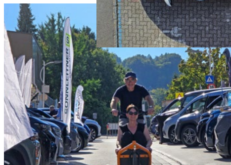
Radverkehr, Foto: Alexander Strobl