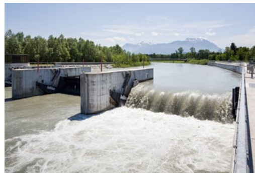
Stadtwerke Feldkirch, Kraftwerk Illspitz

Die Pionierstadt-Partnerschaft trägt dazu bei, das Thema Klimaschutz in Feldkirch noch stärker in der Politik sowie in den städtischen Fachabteilungen zu verankern. Die Vernetzung und Zusammenarbeit werden damit gezielt intensiviert. Bei der Entwicklung von konkreten Maßnahmen zur Erreichung der Klimaziele wurde die Stadt von Expert:innen des Austrian Institute of Technology (AIT) unterstützt.