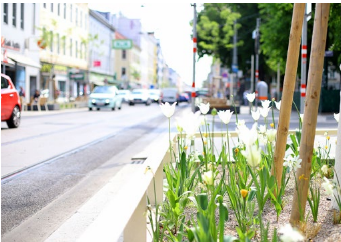
Thaliastraße, Foto: Martin Votava, Stadt Wien

Ein weiteres wichtiges Projekt, das im Wiener Klimagesetz verankert wurde, ist die Klima-Allianz 4 der Stadt Wien. Zielsetzung ist die langfristige Kooperation und Zusammenarbeit zwischen der Stadtverwaltung, Wiener Unternehmen und weiteren wichti-