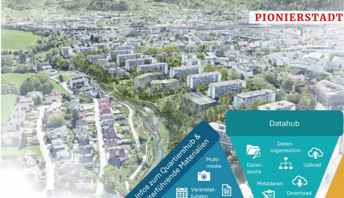
Goethesiedlung, Abb.: Stadt Salzburg