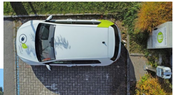
E-Ladestation, Foto: Alexander Strobl