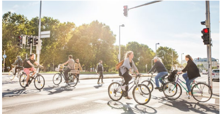
Radfahren in der Stadt, Foto: Peter Provaznik, Mobilitätsagentur Wien

Ausgewählte Wiener Bestandsquartiere werden anhand klimarelevanter Kriterien analysiert und gemeinsam wird herausgearbeitet, wie die Transformation der Quartiere beschleunigt werden kann. Neben der Energiewende muss Wien auch die Mobilitäts- und Ressourcenwende schaffen. Da die notwendigen Maßnahmen an den einzelnen Standorten unterschiedlich sind, werden in den Pilotquartieren verschiedene Schwerpunkte bearbeitet.