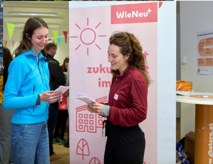
WieNeu+ Grätzveranstaltung, Foto: Markus Wache, Stadt Wien