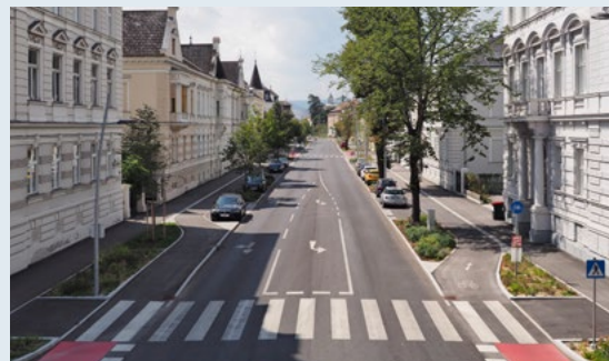
E-Stadtbus, Sonnenstrom und Ringstraße, Radverkehr

Große, mittlere und kleinere Städte arbeiten aktuell an zukunftsweisenden Strategien und Maßnahmen, um möglichst rasch klimaneutral zu werden. Als Pionierstädte werden sie dabei im Rahmen der Forschungsinitiative Mission „Klimaneutrale Stadt“ vom Bundesministerium für Innovation, Mobilität und Infrastruktur (BMIMI) sowie vom Klima- und Energiefonds begleitet und unterstützt.