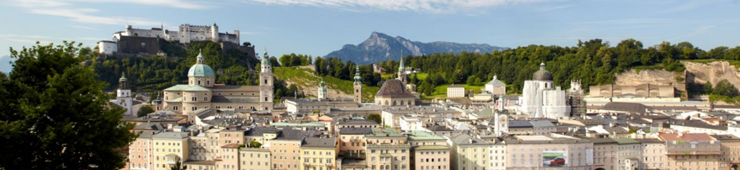
Stadt Salzburg, Foto: Klima- und Energiefonds/Jürgen Zacharias