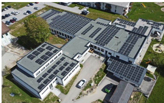
230 kWp-PV-Anlage, Volksschule und Kindergarten Neukirchen, Foto: Alexander Strobl

klimaneutralerstadt.at/de/projekte/pionierstaedte/altmuenster-2040.php