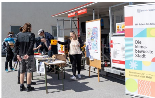
Tag der offenen Tür Recyclinghof

Die Stadt Salzburg testet aktuell das webbasierte Planungs- und Monitoringinstrument Climate View. Das Tool bietet eine standardisierte Methode, um Klimaneutralitätsfahrpläne digital zu erfassen und so zu strukturieren, dass sie effizient mittels KPIs überprüft und bei Umsetzungslücken aktualisiert werden können. Treibhausgasemissionen werden strukturiert nach unterschiedlichen Sektoren abgebildet. Zudem lassen sich verschiedene Szenarien und Reduktionspfade simulieren, mit konkreten Maßnahmen verknüpfen und hinsichtlich ihrer CO 2 -Emissionen quantifizieren. Auf dieser Basis können die Fortschritte anhand von Kennzahlen überprüft und Maßnahmen bei Bedarf angepasst werden. Pia Schauz erläutert: „So sehen wir evidenzbasiert in welchen Bereichen wir nachsteuern bzw. Tempo aufnehmen müssen, um unsere Klimaziele zu erreichen.“