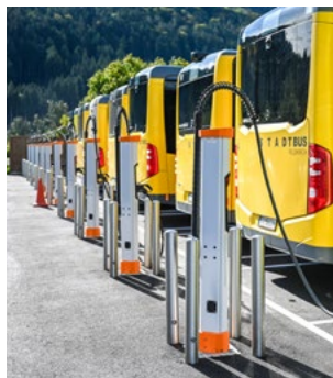
Stadtbus Feldkirch

Die Stadt Feldkirch hat als Basis für die Erarbeitung ihres Klimaneutralitätsfahrplans verschiedene Entwicklungspfade mit wissenschaftlicher Unterstützung analysiert. Aktuelle Schwerpunkte liegen auf dem Ausbau der Nahwärme, der Förderung nachhaltiger Mobilitätsangebote sowie auf ersten Planungen für das Pilotquartier Magdalenastraße.