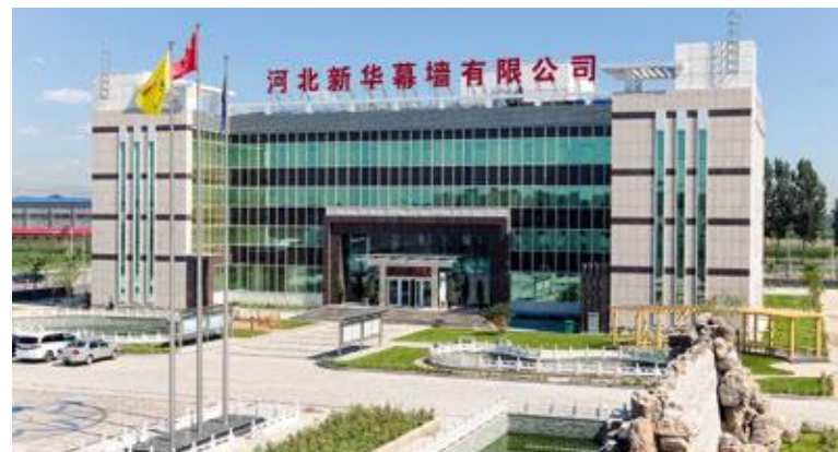
Büro-Passivhaus Zhuozhou/China, Foto: Schöberl & Pöll GmbH

In der zentralen Lüftungseinheit wurden zwei seriell angeordnete Rotationstauscher eingesetzt, wobei ein Rotor auf Wärme- und der Zweite auf Feuchterückgewinnung optimiert ist. Der Wärmetauscher ist ein Kondensationsrotor mit einer hocheffizienten Wärmerückgewinnung, der Feuchtetauscher ein hygroscopischer Enthalpierotor. Aufgrund der klimatischen Bedingungen ist an diesem Standort die Entfeuchtung der Außenluft eine große Herausforderung. Diese erfolgt mehrstufig sowohl passiv über den Feuchtetauscher als auch in einem aktiven Entfeuchtungsprozess. Über einen Wärmepumpen-betriebenen Kühler wird die Luft heruntergekühlt, bis der Taupunkt erreicht ist und die Luftfeuchtigkeit kondensiert. Die raumweise Temperierung und Kontrolle