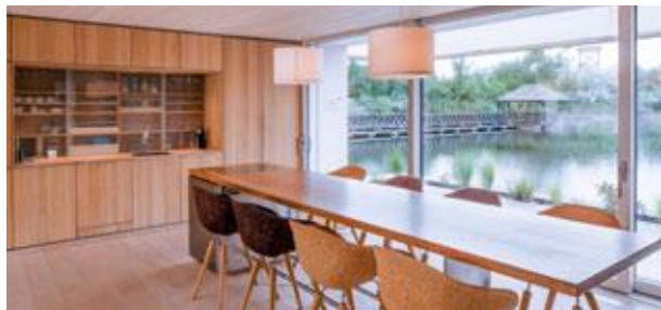
LISI Haus, Innenraum, Blaue Lagune Wien