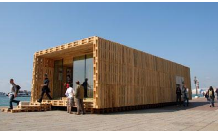
Palettenhaus, Architekturbiennele Venedig 2008, Foto: palettenhaus.com

2009 wurde das Palettenhaus im Rahmen des Programms „Haus der Zukunft“ (bmvit) als Passivhaus weiterentwickelt und zur Serienreife gebracht. Dies inkludierte statische und bauphysikalische Nachweise, die dreidimensionale Simulation der Wärmebrücken sowie die Berechnung des langjährig zu erwartenden Energiebedarfs. Dazu wurden exemplarisch zwei Szenarien untersucht: die temporäre Zwischennutzung von Palettenhäusern in aspern Die Seestadt Wiens sowie die Errichtung eines Low-cost-Gebäudes in Südafrika.