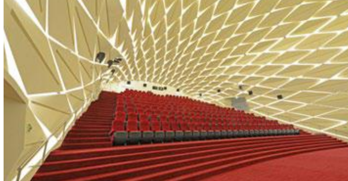
Sheikh Zayed Desert Learning Center, Foto: Chalabi Architekten & Partner ZT GmbH

Eine Zielsetzung der Technologieprogramme „Haus der Zukunft“ und „Stadt der Zukunft“ des bmvit ist es, die Erkenntnisse aus den Forschungsaktivitäten einer breiten Umsetzung zuzuführen. Unter anderem werden „Leuchttürme der Innovation“ im Ausland reali-