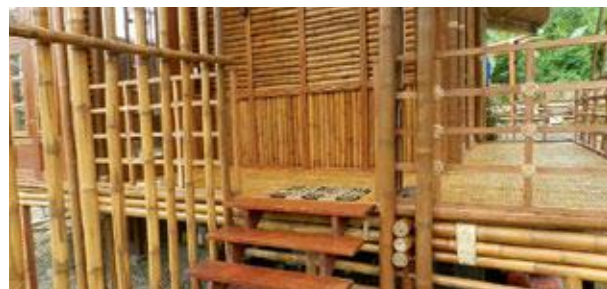
Zero Carbon Resorts, Demonstrationsgebäude

Das Gebäude ist energieautonom und wird zu 100 Prozent mit erneuerbaren Energien betrieben. Die elektrische Energie für das gesamte Resort wird mit Photovoltaik bereitgestellt. Die Warmwasserbereitung erfolgt mit Solarthermie. Auch für die Beleuchtung nutzt man das Sonnenlicht. Ein Tageslichtbeleuchtungssystem leitet über Kanäle das Licht von außen in die innen liegenden Räume. Die Gestaltung des Daches wurde so ausgeführt, dass das Regenwasser zentral gesammelt werden kann. Nur etwa 10 % der jährlichen Niederschläge reichen aus, um den gesamten Wasserbedarf des Gebäudes zu decken. Durch den Einbau von wassersparenden Toiletten, Duschköpfen und Wasserhähnen konnte der Brauchwasserbedarf eingeschränkt und die Abwässer reduziert werden. Mit Hilfe einer biologischen Wasseraufbereitung werden die Abwässer gereinigt. Trinkwasser kann durch einfache Do-it-yourself-Filter aus Regenwasser gewonnen werden.