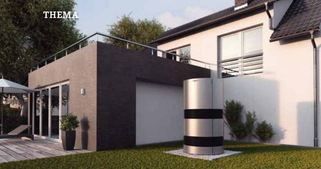
Luft-Wasser-Wärmepumpe, Foto: Viessmann Werke