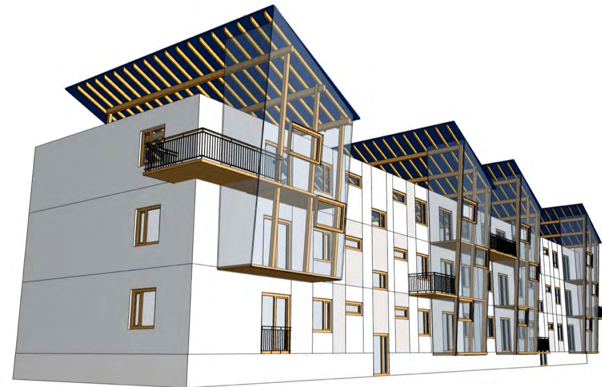
Sanierung: Schritt4 - Fertigstellung