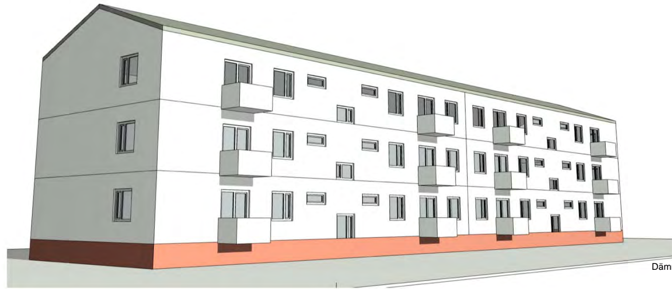
Bestand - Radegunderstrasse