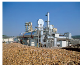
Werk 5, Homogen, Neudörfel