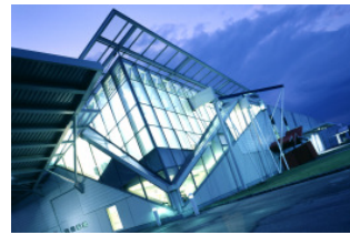
Werk 3, St. Veit