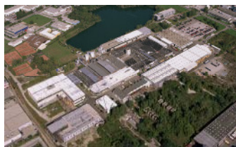
Werk 4, Wr. Neudorf