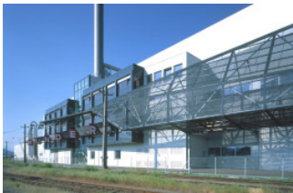
Werk 1, St. Veit