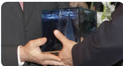
Projektverlauf/ Erfolgreicher Trigos... Seite 2