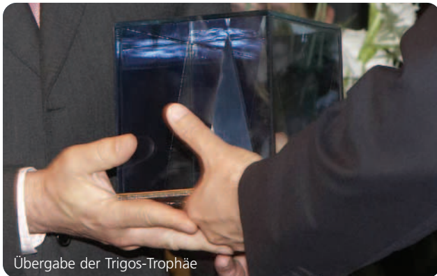
Übergabe der Trigos-Trophäe