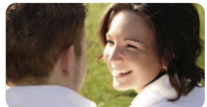
Unternehmen am Wort... Seite 4