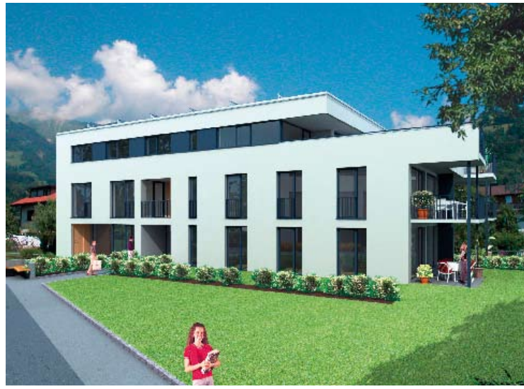
Abb. 8–9: Solar Habitat: Architekten Hans Riemelmoser und Sture Larsen, Bauträger: Ammann Wohnbau GmbH.

demonstriert das gesamte Spektrum im Zusammenspiel von Sonnenenergienutzung und Wärmekonservierung (Abbildungen 8–9).