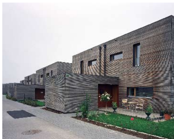
Abb. 12 (ganz links): S I P – Siedlungsmodelle, Prototyp am Hauptplatz von Grieskirchen. Abb. 13 (links): S I P – Siedlungsmodelle in Passivhausqualität. Eingangsseite Reihenhaussiedlung Winklarn von Poppe*Prehal Architekten.