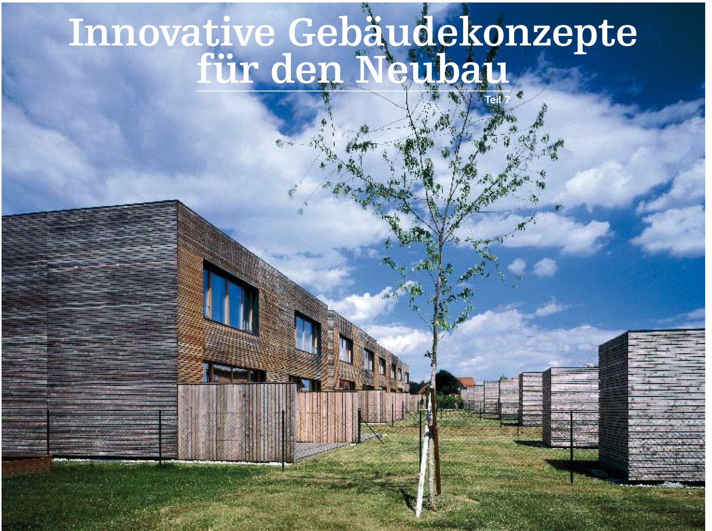
Abb. 1: SIP – Siedlungsmodelle in Passivhausqualität: Gartenseite Reihenhaussiedlung Winklarn von Poppe*Prehal Architekten.