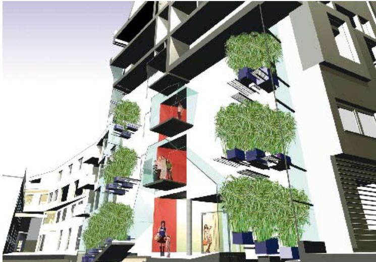
Abb. 2–3: Themenwohnen Musik: Parksichten, Pflanzen-Pufferräume. Visualisierungen: pos-architekten