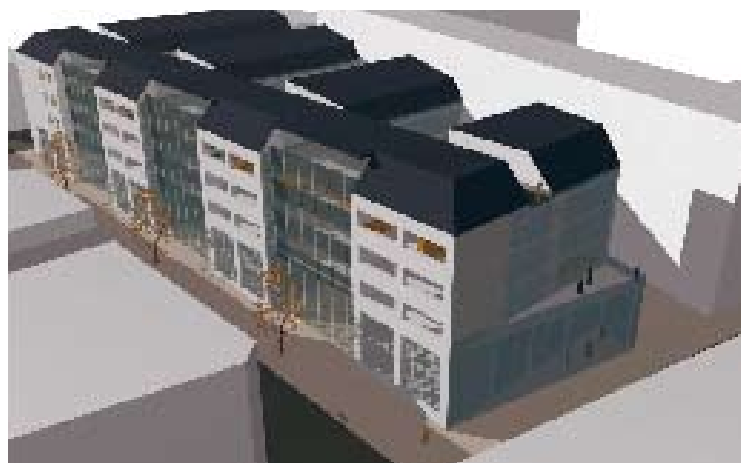
Abb. 10–11: Multifunktionaler Stadtnukleus, Mischtypologie für den Standort Mayssengasse 28–30, 1170 Wien, Perspektiven. Architekturbüro Architekt Gerhard Herzog.