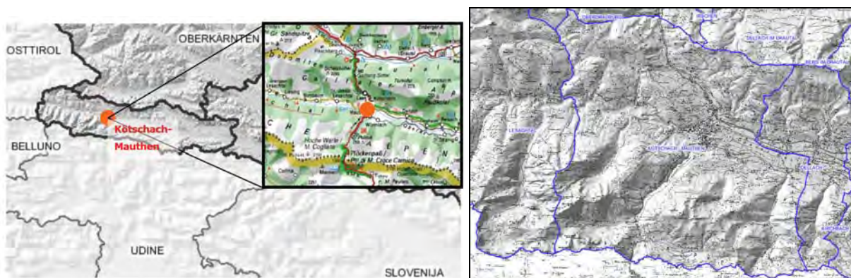
Abb. 1: Gemeindegebiet Kötschach-Mauthen

Die Marktgemeinde Kötschach-Mauthen (siehe Abbildung 1 ), etwa 3.500 Einwohner, etwa 155 km 2 Katasterfläche bestehend aus 31 Ortschaften, liegt im Südwesten des Bundeslandes Kärnten (im Oberen Gailtal bzw. Unteren Lesachtal) und gehört zur Karnischen Region und zur Kulturachse "Via Iulia Augusta". Kötschach-Mauthen ist ein Pionierort für erneuerbare Energie und der ortsansässige Energieversorger „Alpen Adria Energie Naturenergie“ erhielt im Jahre 1995 für seine beispielhaften Energieprojekte den „Europäischen Solarpreis“ verliehen. Die Marktgemeinde Kötschach-Mauthen hat im Mai 2008 den Verein „energie:autark Kötschach-Mauthen“ gegründet und ein Leitbild ausgearbeitet mit dem Ziel Energieautarkie bis 2020 zu erreichen. Energieautark bedeutet, dass in der Region insgesamt die Energieproduktion aus erneuerbaren Quellen für Strom, Wärme und Treibstoffe gleich hoch ist wie der regionale Energiebedarf für die Energiedienstleistungen. Im Leitbild sind Maßnahmen zur Reduzierung des Endenergiebedarfs (z.B. Energieeinsparungen durch Dämmmaßnahmen, Informationsveranstaltungen) und zur Steigerung der Endenergieerzeugung aus erneuerbaren Energiequellen (wie Verwendung von Biomasse zur Deckung des Wärme- und Kühlbedarfs anstelle fossiler Brennstoffe, Ausbau der Ökostromerzeugung, Treibstoffproduktion aus Biogas sowie Einsatz von Ökostrom in Elektrofahrzeugen) beinhaltet. Diese sollen letztendlich zur angestrebten Energieautarkie führen.