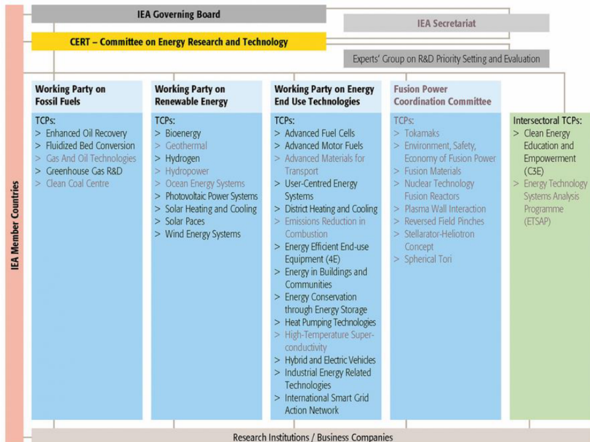
Abbildung 1: Struktur des IEA Netzwerks und TCPs. TCPs ohne österreichische Beteiligung (in 2018) sind in grau dargestellt.

Durch die Teilnahme an den IEA Bioenergy TCPs können internationale Entwicklungen für die strategische Ausrichtung der österreichischen Forschungs-/Technologie und Innovations- (FTI) Politik frühzeitig wahrgenommen und neue Forschungsbereiche in Österreich durch internationale Unterstützung aufgebaut werden. Im Gegenzug erfolgt die Einbringung österreichischer Expertise und Erkenntnisse aus nationalen und EU Projekten in das IEA Forschungsnetzwerk.